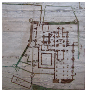
Fig. 3. Troisième plan conservé aux Archives nationales [vers 1660-1670].

Le troisième plan conservé aux Archives nationales 14 , précisément légendé 15 et commenté, donne des précisions supplémentaires sur le