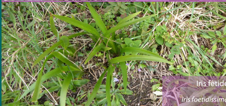
Iris fétide Iris foetidissima