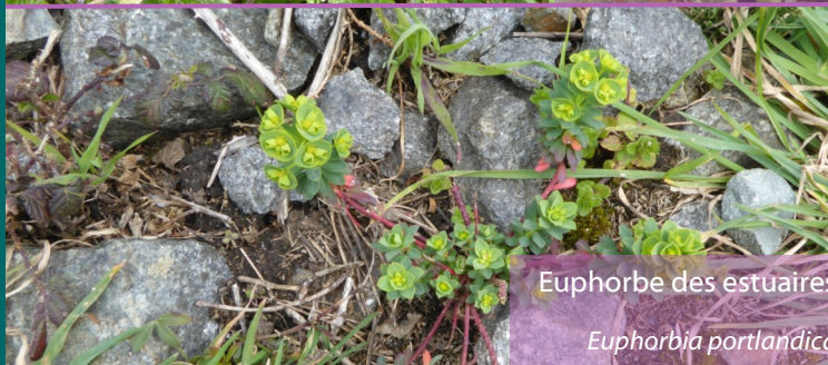
Euphorbe des estuaires Euphorbia portlandica