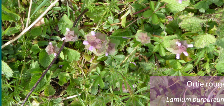
Ortie rouge Lamium purpureum