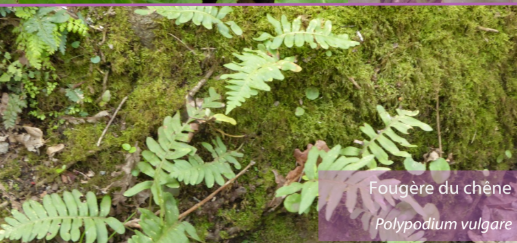
Fougère du chêne Polypodium vulgare