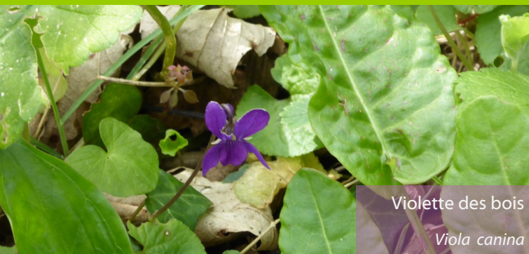
Violette des bois Viola canina