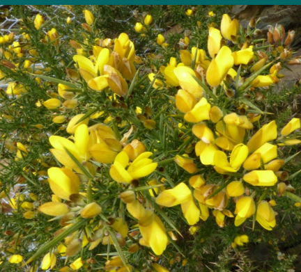
L'ajonc espèce emblématique de la Bretagne

La strate arbustive est très exposée au vent venant du large. Composée d'ajoncs, de genêts et de bruyères, elle est peu diversifiée. Des arbres, comme le chêne pédonculé, poussent plus lentement avec un port en drapeau, lié aux conditions climatiques difficiles et au sol peu profond par endroit.