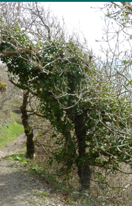
Des chênes sculptés par le vent